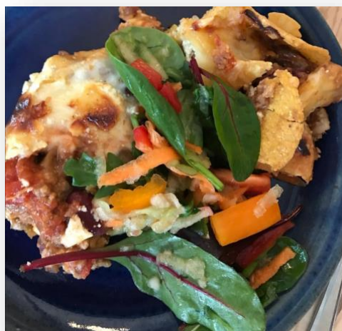
«Vegetarisk lasagne av økologiske råvare»

Vi legger vekt på å gå barna et sunt, vegetarisk, kosthold basert på økologiske råvarer. Gjennom uka serverer vi grøt, suppe, varme retter som grønnsaksgratenger, lasagne, pastaretter osv. Alle har glede av den gode matlukten som hver formiddag sprer seg ut i hele huset. Det styrker appetitten, vekker sansene og øker matgleden. Å bli introdusert for mange forskjellige sanse- og smaksopplevelser i tidlig alder kan gi grobunn for et variert og sunt kosthold senere i livet. Etter hvert måltid serverer vi økologisk frukt, og eggene fra egen hønsegård er naturligvis fra frittgående høner med god plass til bevegelse.